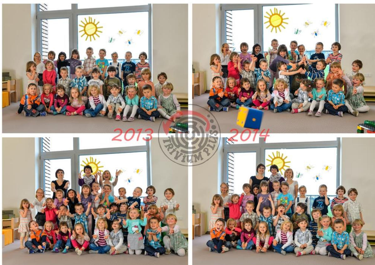
MŠ 2013-2014 I