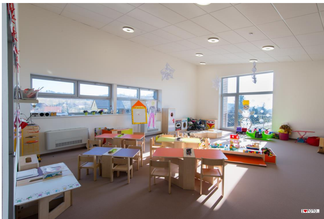
Interier školky 1