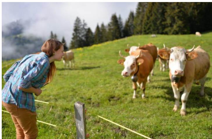
Obrázek 1 - dorozumívání s místními obyvateli

na dobývání alpských vrcholů po trasách horolezců neměli čas, protože jsme chtěli vidět i jiná zajímavá místa. První poznávací zastávka byla v německé Kostnici na břehu Bodamského jezera (třetí největší v Evropě), kde byl před téměř 600 lety upálen Mistr Jan Hus. Odsud nás řeka Rýn dovedla k Rýnským vodopádům. Ty jsou obdivuhodné tím, jak rychle a prudce se jimi valí voda. Právě množstvím vody, které se zde prožene za sekundu, se Rýnské vodopády řadí mezi nejmohutnější svého druhu v Evropě.