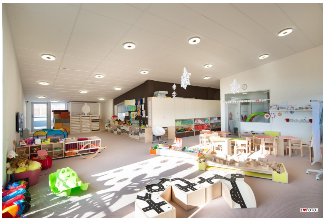
Interiér školky 2