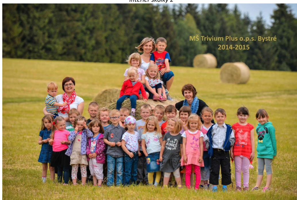
MŠ 2014-2015 I - 21 -