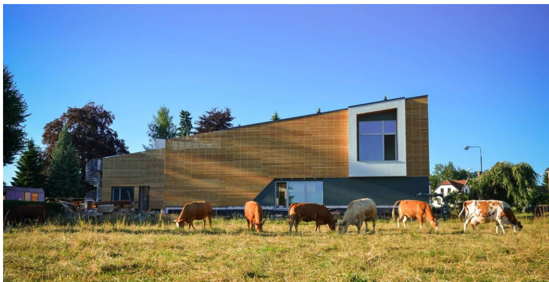
MŠ v multifunkčním centru ELADA 1