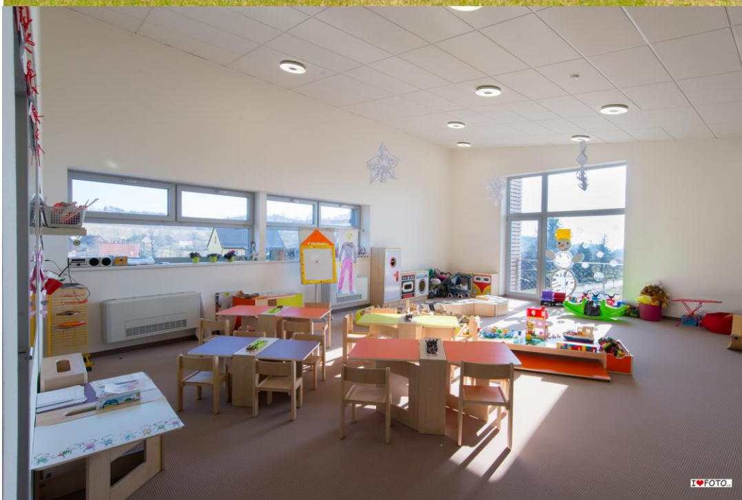
Interiér školky 1