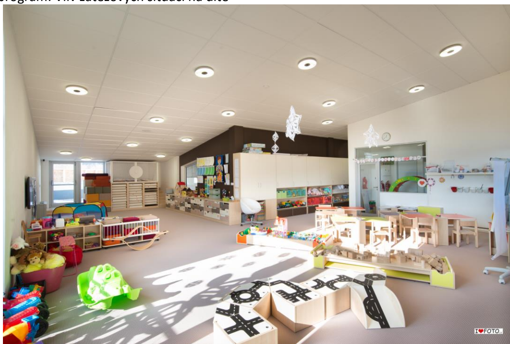
Interiér školky 2

- vzdělávací program: Vliv zátěžových situací na dítě