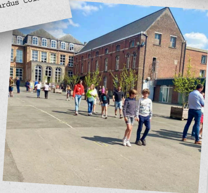
Studenti na školní dvoře