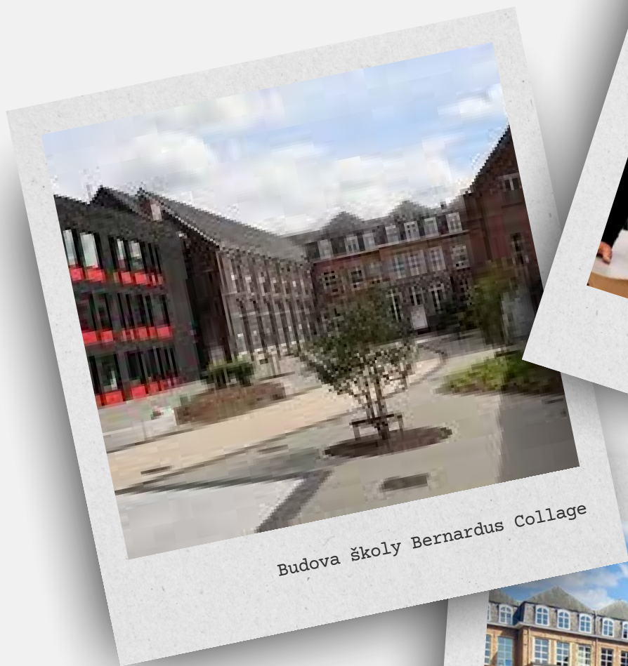
Budova školy Bernardus Collage